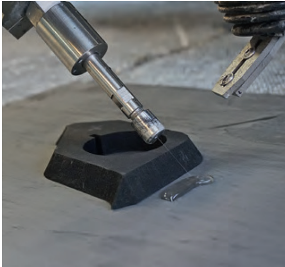
Bild 1: Die Wasserstrahlschneidetechnik bietet sich heute für die Fertigung vieler Dichtungs- und Formteillösungen an