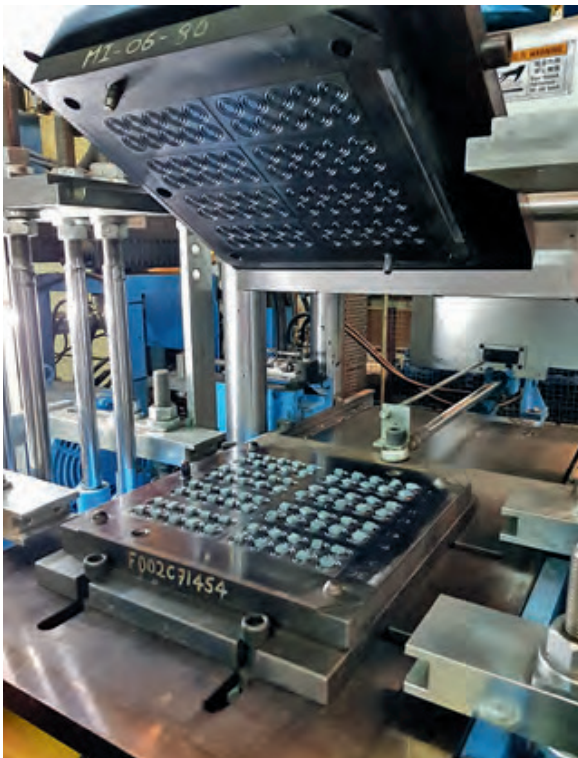
Bild 3: Compression Moulding erlaubt den einfachen Übergang vom Prototyping in die Großserie

Es hat sich in der Praxis gezeigt, dass erst eine Vollkostenrechnung eine wirkliche Beurteilung der Wirtschaftlichkeit erlaubt.